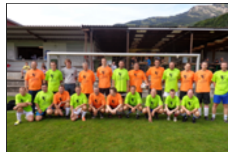
Auch sportlich war der club84 immer wieder aktiv, wie hier beim Plausch-Fussballmatch gegen den SCG-Gönnerverein club333 im Jahr 2013.