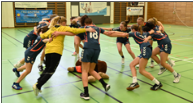
Die U16-Juniorinnen bejubeln ihren Heimsieg in der ersten Aufstiegsparterie gegen den HBC Münsingen.

unbezungen. Und zum Abschluss des Tages setzt sich auch die erste Herrenmannschaft hauchdünn durch: Das 24:23 gegen den Tabellenletzten Muri 2 bedeutet ein weiteres wichtiges Lebenszeichen im Kampf um den Ligaerhalt. Als einziges Team auswärts anzutreten haben an diesem Samstag die U14-Juniorinnen, die in Arbon wie die Kolleginnen aus den weiteren Juniorinnen-Mannschaften ebenfalls in den Kampf um den Inter-Aufstieg involviert sind. Am Bodensee unterliegen sie der SG Lakers mit 27:34, womit fürs Rückspiel eine echte Herkules-Aufgabe wartet.