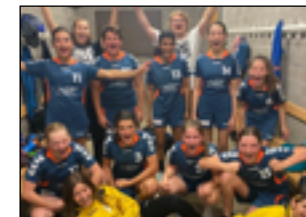
Die U14-Juniorinnen nach ihrem gewonnenen Heimspiel vom 23. Oktober.

Zu einer HCG-Saisonpremiere kommt es an diesem Samstag in Kriens: Gleich mit zwei Mannschaften treten dort die U11-Junioren zu ihrem ersten Turnier der neuen Spielzeit an. Punkte gibt es – mit Ausnahme für das Siegerteam im direkten Duell der beiden HCG-Equipen – keine, gleichwohl vermögen die jungen Goldauerinnen und Goldauer bereits einige positive Akzente zu setzen und zeigen überdies enorm viel Freude am Handballsport.