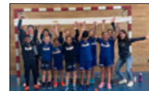
Am 23. Oktober durften die U11-Junioren des HCG endlich ihren Saisonestand geben.