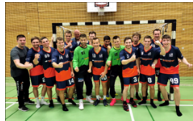
Am 18. September durfte das Herren-Fanionteam erstmals in der laufenden Spielzeit über Punkte jubeln.

Im ersten Schwyzer Derby der Saison kassiert das Herren-Fanionteam beim HC Einsiedeln eine klare Niederlage: 21:30 lautet das deutliche Schlussergebnis aus Sicht der Schwyzer Spielgemeinschaft.