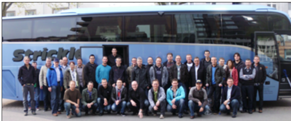
Zahlreiche Mitglieder nahmen am Ausflug nach Heidelberg im Jahr 2012 teil, inkl. Besuch eines Handballspiels der Rhein-Neckar Löwen in Mannheim.

Mit ein paar Bildern von vergangenen Anlässen möchten wir in Erinnerungen schwelgen und hoffen euch baldmöglichst wieder das volle Programm bieten zu können.