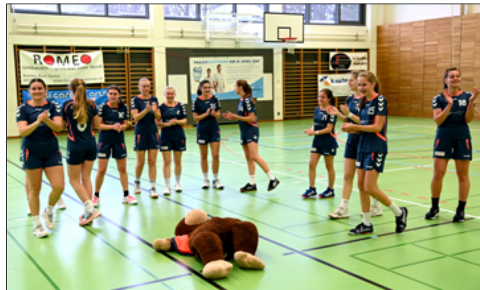
Am 26. März kommt es endlich zur Goldauer Inter-Premiere für die U16-Juniorinnen.

14.00 Uhr: Shooters FU16-Inter - SG Les Mouettes de Genève