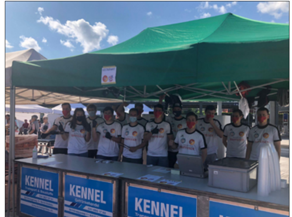
Die Helferinnen und Helfer des HCG und vom Sportclub Goldau am Bahnhoferöffnungsfest.

Am 11. September 2021 fand das Fest zur offiziellen Eröffnung des neuen Bahnhofareals in Arth-Goldau statt. Der HCG stellte dabei ein Helferteam und griff den Organisatoren an einem Verpflegungsstand als tatkräftige Hilfe unter die Arme. Der Stand wurde in Zusammenarbeit mit dem Sportclub Goldau betrieben. Dem Fussballverein wird an dieser Stelle noch einmal herzlich für die gute Zusammenarbeit gedankt!