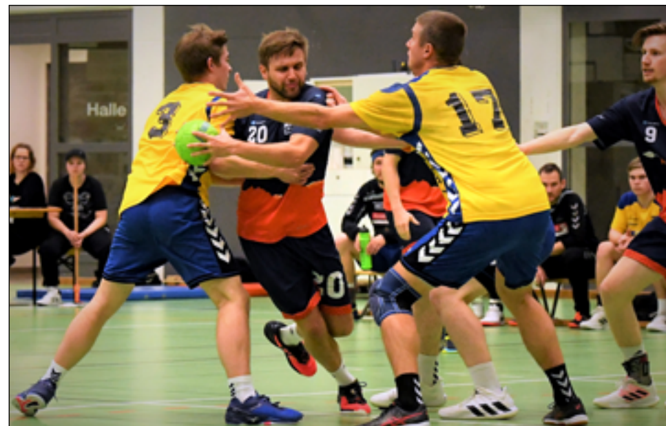
Szene aus dem Heim-Derby gegen Muotathal aus der Vorrunde. Am 19. Februar steht für das Herren-Fanionteam gegen Einsiedeln das nächste Kantonsduell in Goldau auf dem Programm.