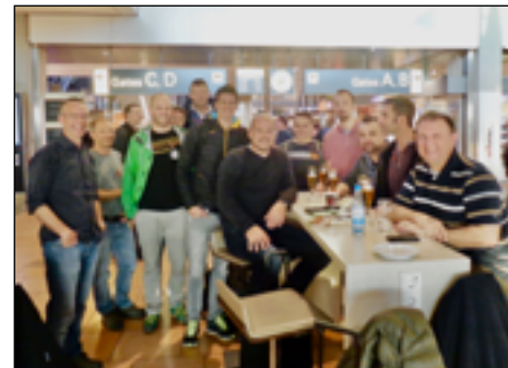
Auch 2016 zog es den club84 wieder für einen Handball-Event nach Deutschland, diesmal zum Final Four-Turnier des deutschen Pokals in Hamburg. Hier sehen wir die Teilnehmer des Ausflugs zusammen mit dem Schweizer Handball-Star Andy Schmid.