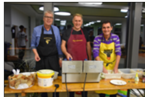
Foto vom Sponsoren- und Handballer-Apero in der BBZG-Halle aus dem Jahr 2019.